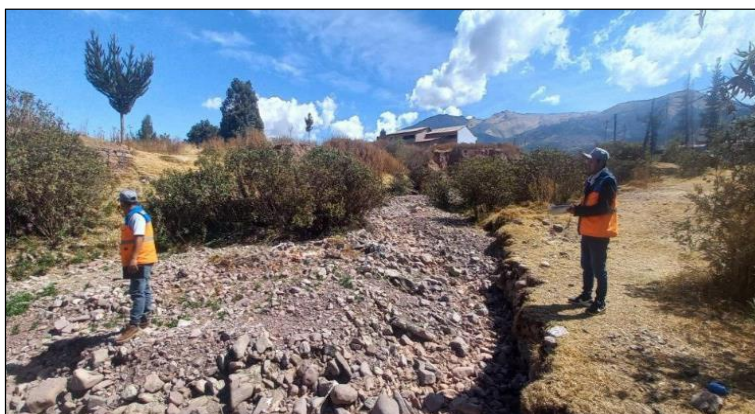
FIGURA N°02: TRAMO CRÍTICO EN EL RIO HUACOTOMAYO, DISTRITO DE SAN JERONIMO, PROVINCIA DE CUSCO - CUSCO, SE APRECIA EL CAUCE COLMATADO.