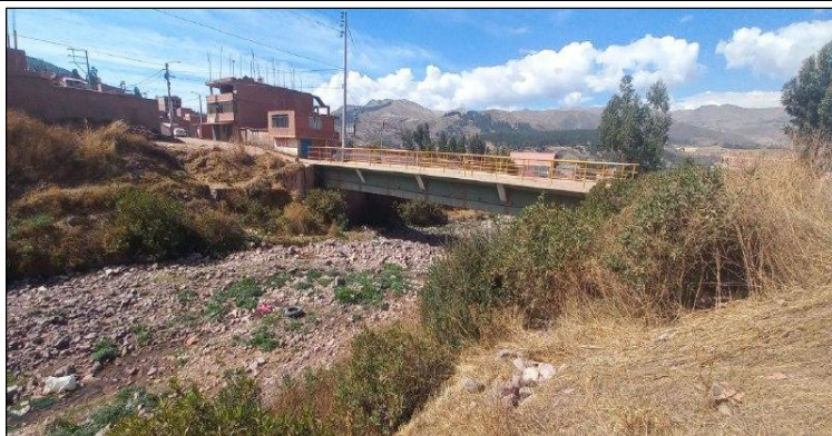
FIGURA N°01: TRAMO CRÍTICO EN EL RIO HUACOTOMAYO, DISTRITO DE SAN JERONIMO, PROVINCIA DE CUSCO - CUSCO, SE APRECIA EL CAUCE COLMATADO.